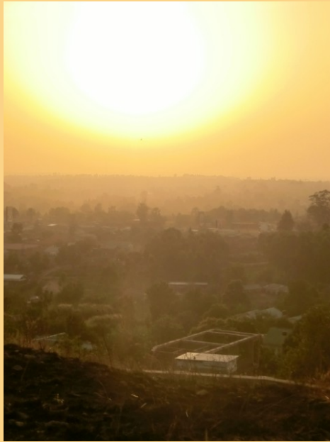
(Sonnenuntergang in Arua)

*Träume nicht dein Leben- lebe deinen Traum*