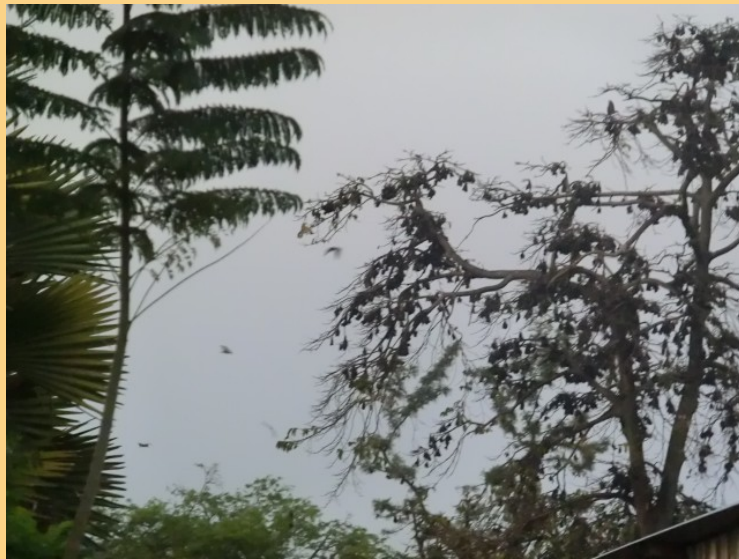
(Ein Baum voller Fledermäuse- unheimlich)