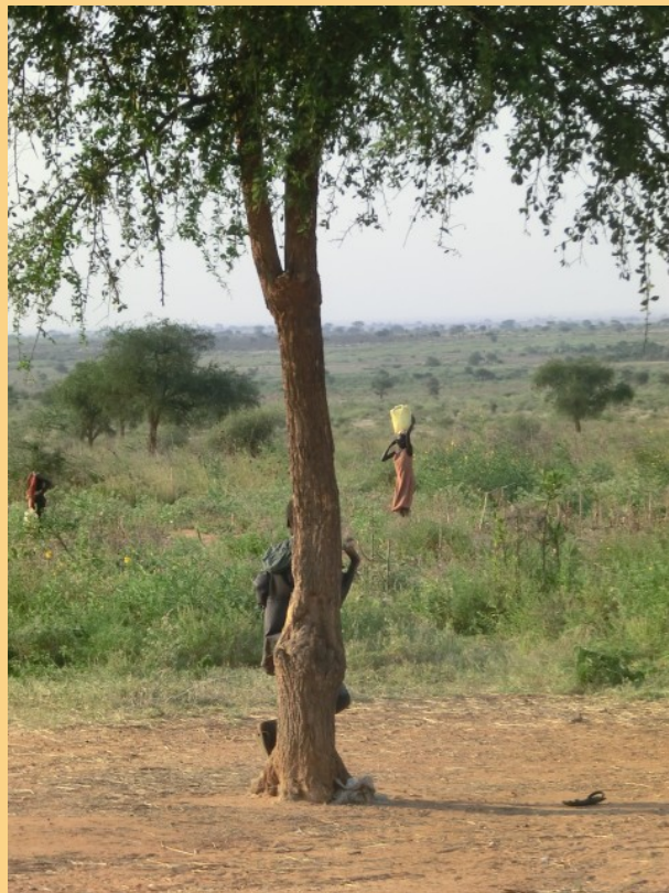
(Matany- dieses Bild beeindruckt mich auf irgendeine Weise)